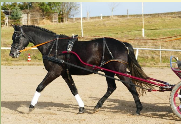
CARLETTO, geb. 2017

Für den fahrinteressierten Kunden präsentieren wir Ein- und Zweispanner, Nachwuchsgespanne wie auch für den Freizeitbereich geeignete Gespanne. Nach der Vorstellung besteht für Sie die Möglichkeit, die Verkaufspferde auszuprobieren, oder Sie vereinbaren einen Termin mit uns, an dem wir Ihnen Ihre ausgewählte Kollektion vorstellen können.