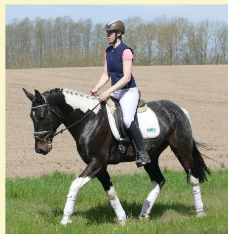
IGOR, Cob Wallach

Wir würden uns freuen, Sie auf unserer Veranstaltung begrüßen zu dürfen.